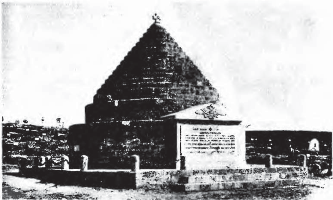
«Галлиполийский памятник», 1921 г.