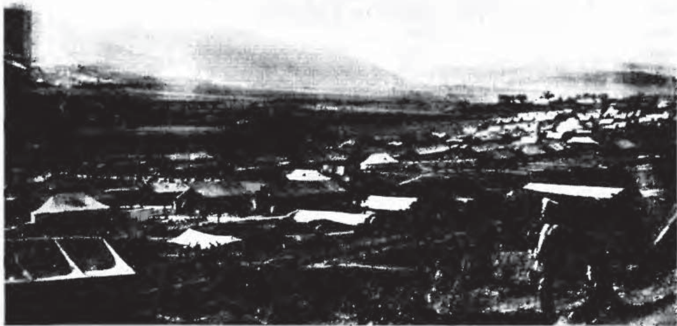
Лагерь 1-го корпуса Русской армии в Галлиполи, 1921 год

лы-от-инфантерии – за боевые отличия. В декабре он тяжело заболел, находился почти при смерти, но выздоровел.