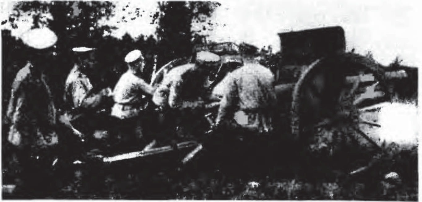
Расчет русского 76-мм артиллерийского орудия во время Первой мировой войны